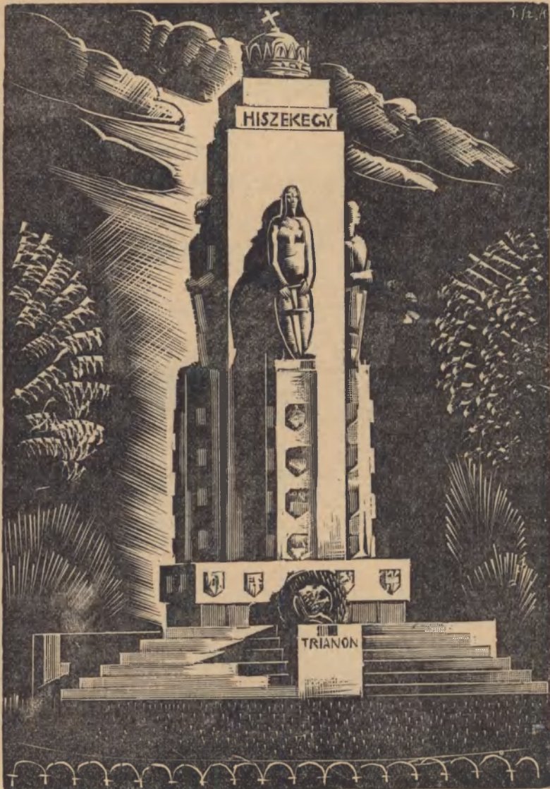
Városunk jelképes irredenta szobra.